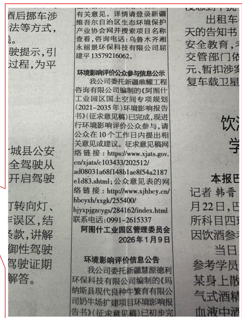
图 3-3(2) 2026 年 1 月 9 日报纸公示内容