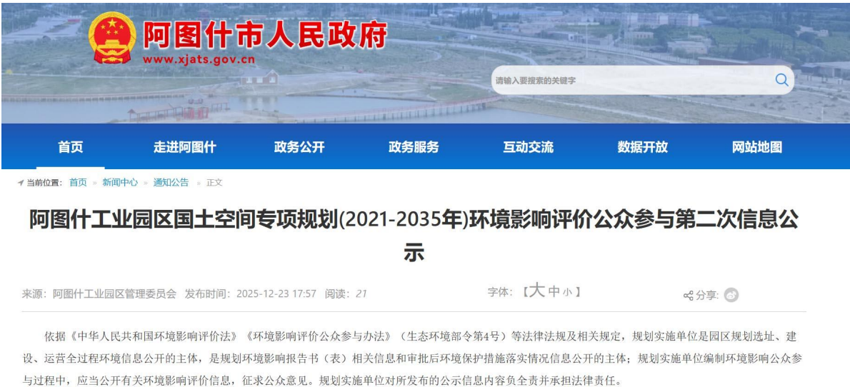
图 3-1 《征求意见稿》网站公示截图

报告书征求意见稿完成后，规划单位在阿图什市人民政府官网发布了本规划第二次环境影响评价信息(www.xjats.gov.cn)。公示时间为 2025 年 12 月 23 日，公示期限及公众提出意见起止时间为 10 个工作日(2025 年 12 月 23 日~2026 年 1 月 6 日)，公示截图见图 3-1。