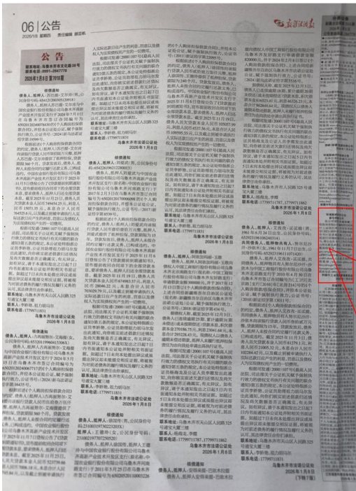
图 3-2(1) 2026 年 1 月 8 日报纸公示内容